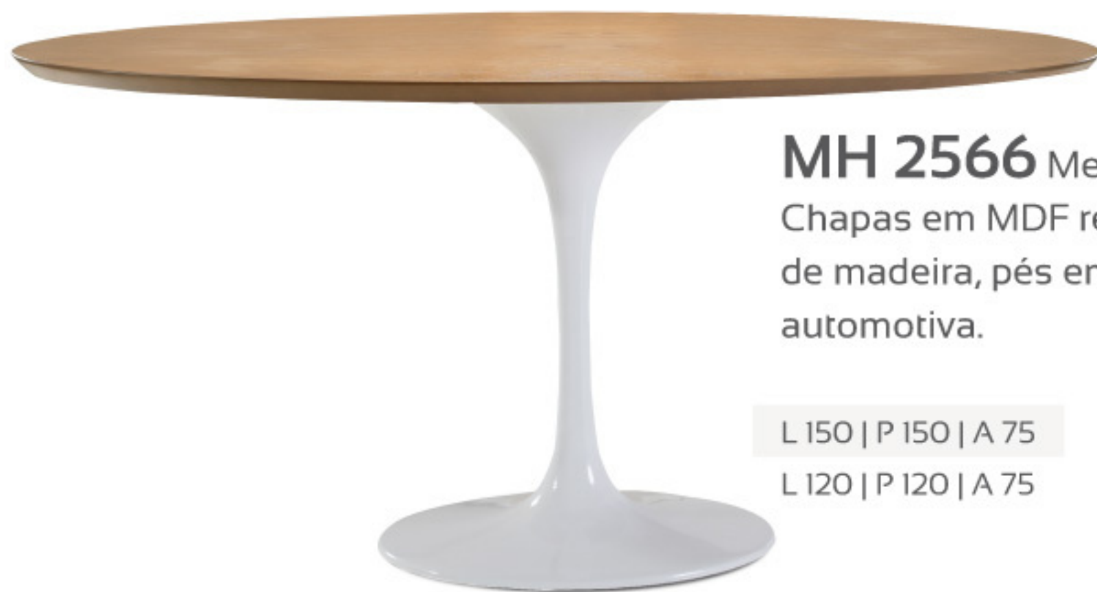
MH 2566 Mesa de Jantar Chapas em MDF revestidas com lâminas de madeira, pés em alumínio com pintura automotiva.