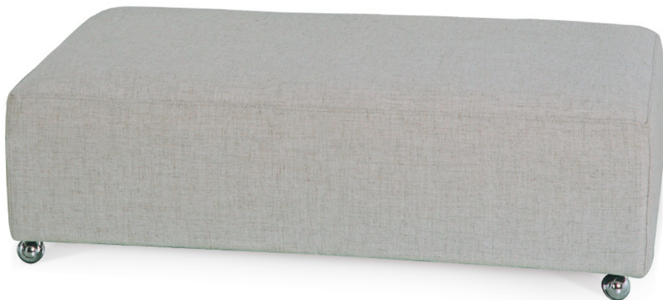
HT 1160 Banqueta Assento fixo, com percintas elásticas.