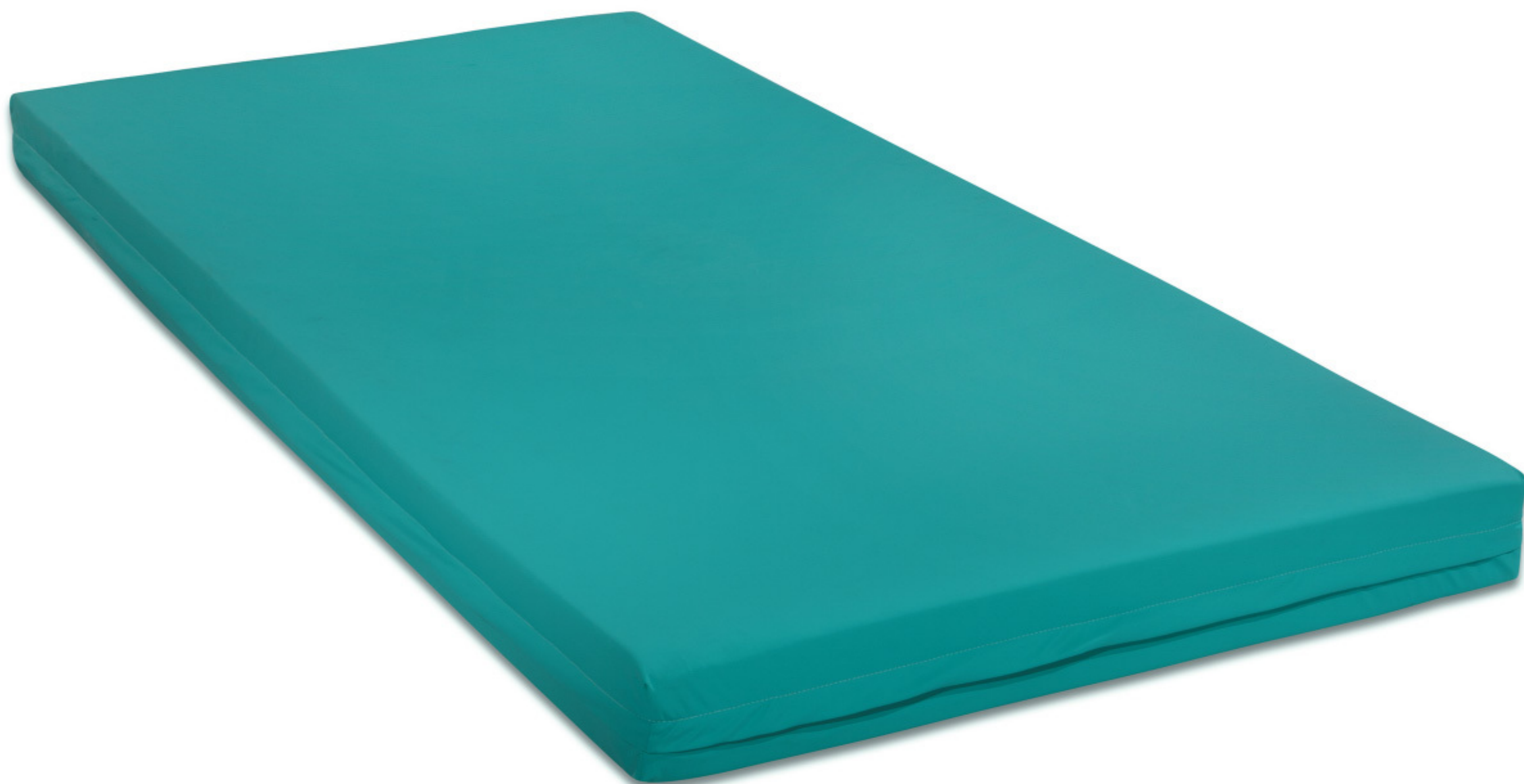
COLCHÃO HOSPITALAR COM TECIDO IMPERMEÁVEL. DISPONÍVEL EM DIVERSAS MEDIDAS.