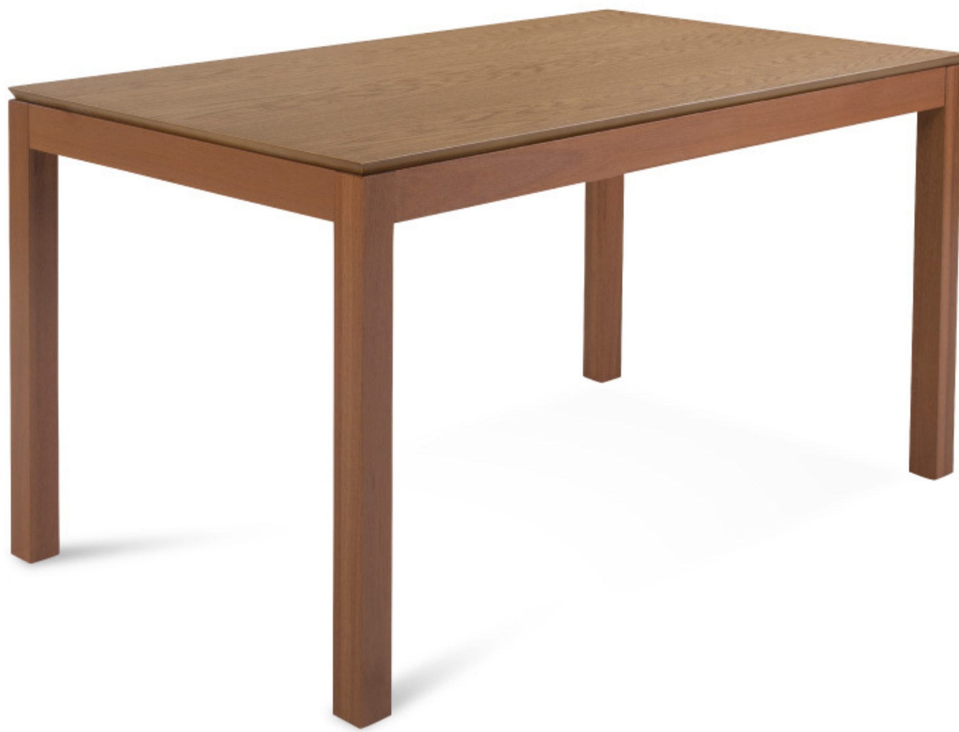
MH 5266 Mesa de Jantar Madeira e chapas em MDF revestidas com lâminas de madeira natural.