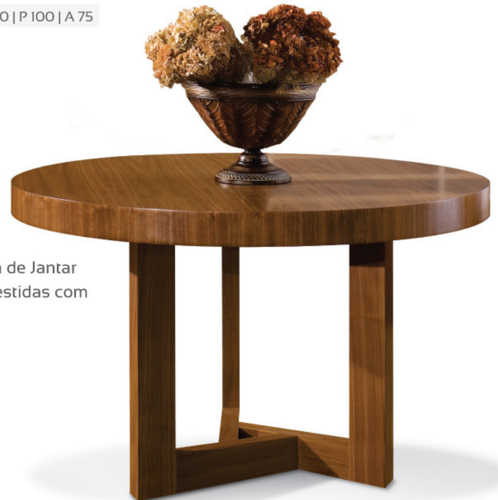
MH 2490 Mesa de Jantar Chapas em MDF revestidas com lâminas de madeira.