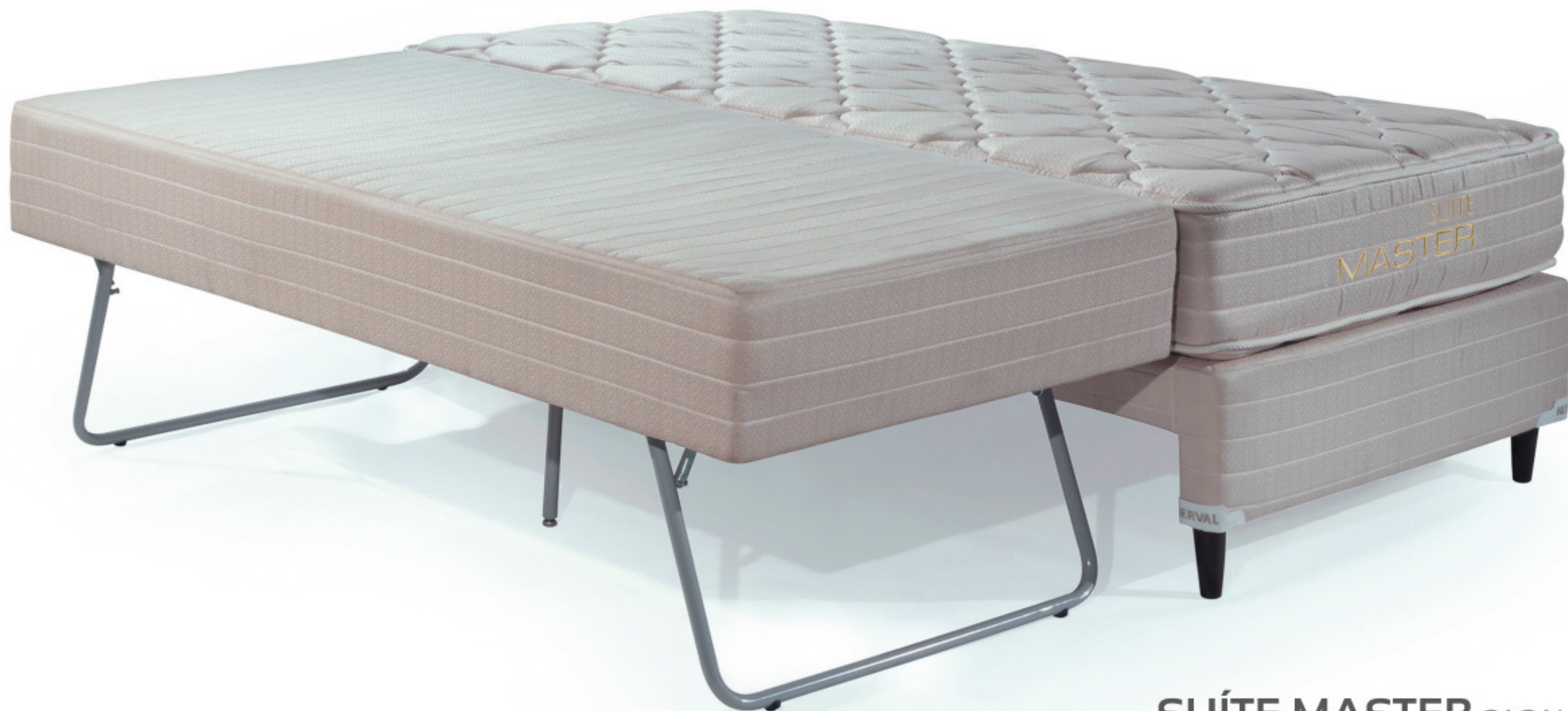
SUÍTE MASTER CASAL MOLAS BONNEL NÍVEL DE CONFORTO: FIRME. DISPONÍVEIS EM DIVERSAS MEDIDAS