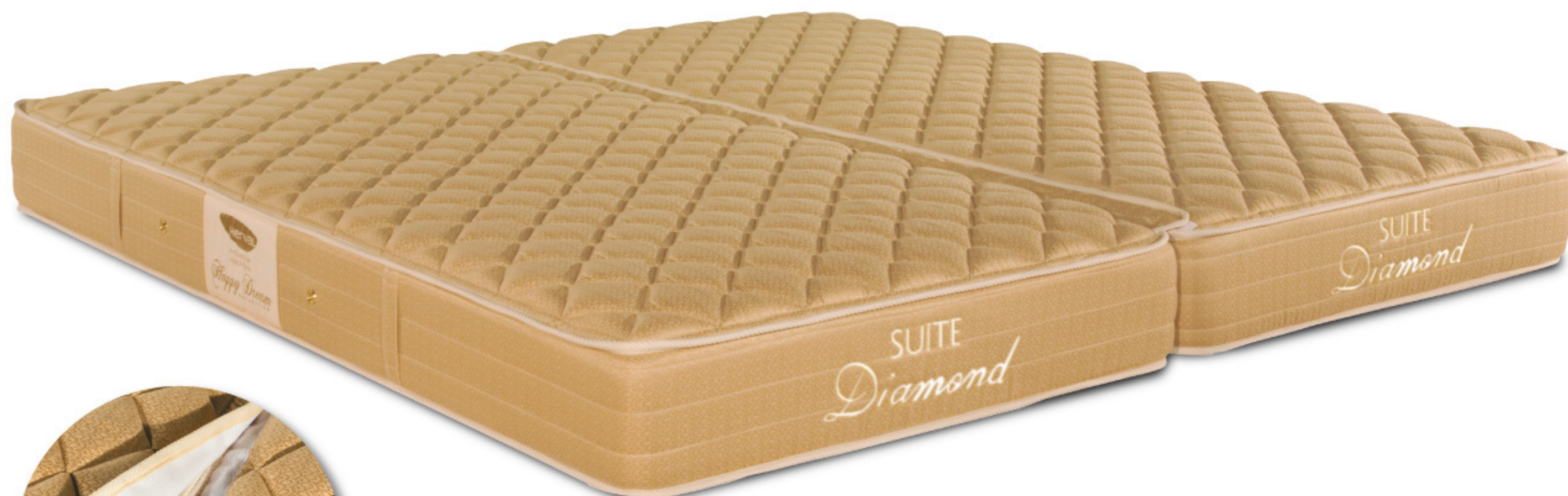
SUITE DIAMOND SOLTEIRO 2 COLCHÕES UNIDOS COM VELCRO - MOLAS ENSACADAS NÍVEL DE CONFORTO: CONFORTÁVEL. DISPONÍVEL EM DIVERSAS MEDIDAS.