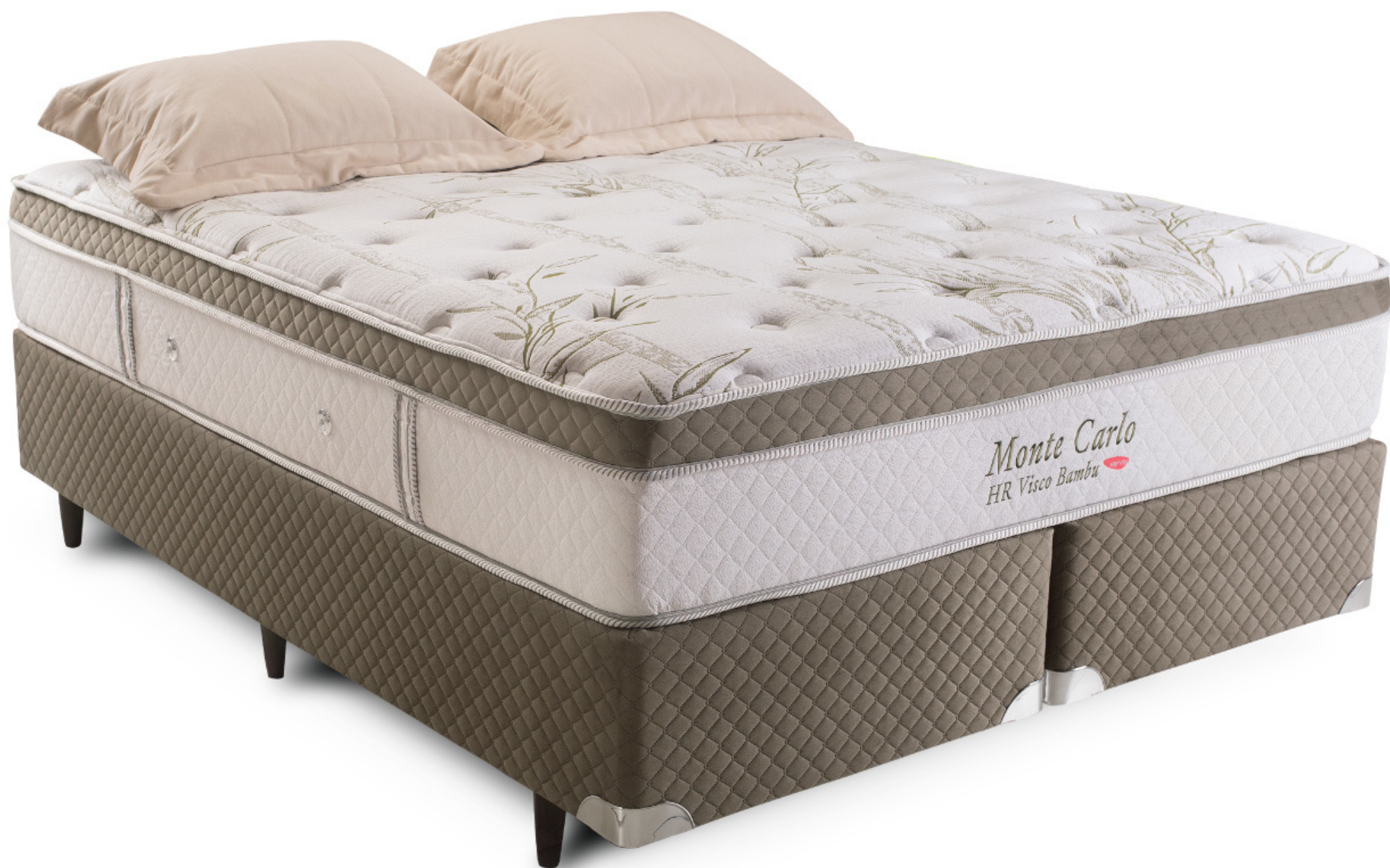
MONTE CARLO - MOLAS ENSACADAS. NÍVEL DE CONFORTO: CONFORTÁVEL. DISPONÍVEL EM DIVERSAS MEDIDAS.