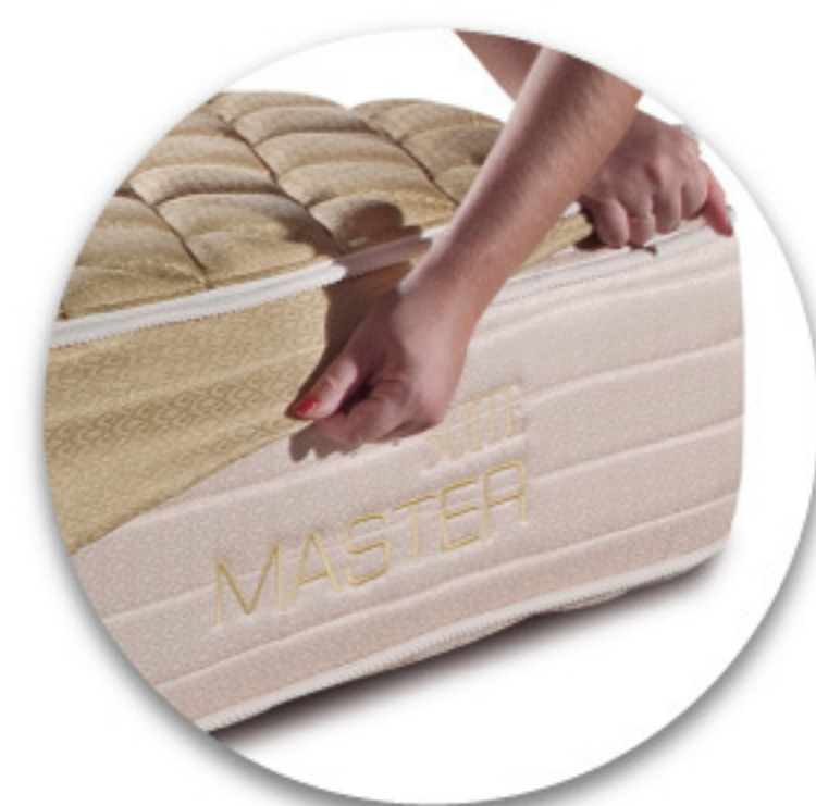
CAPA PILLOW COM LATERAIS