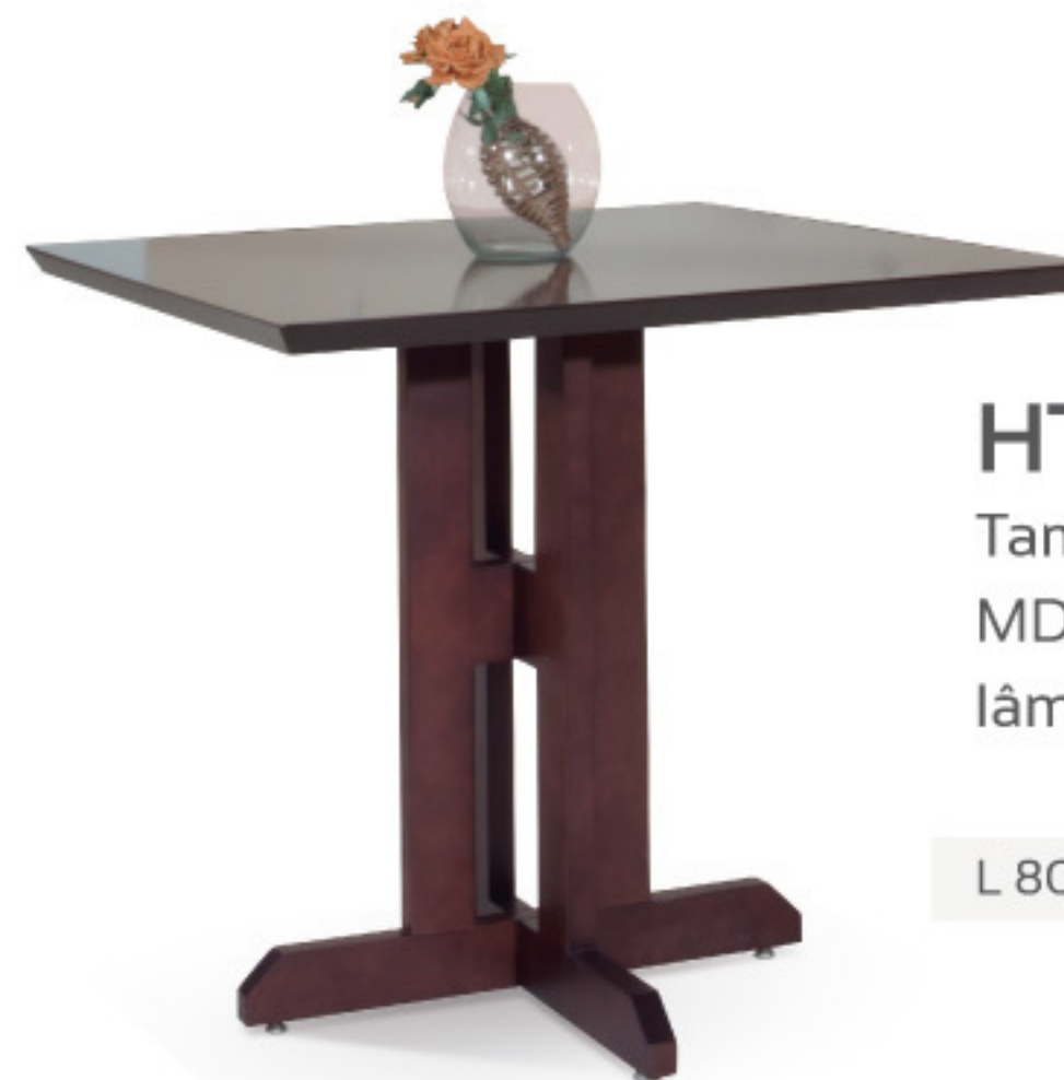
HT 1172 Mesa bar Tampo produzido em chapa de MDF com acabamento em lâminas de madeira natural.