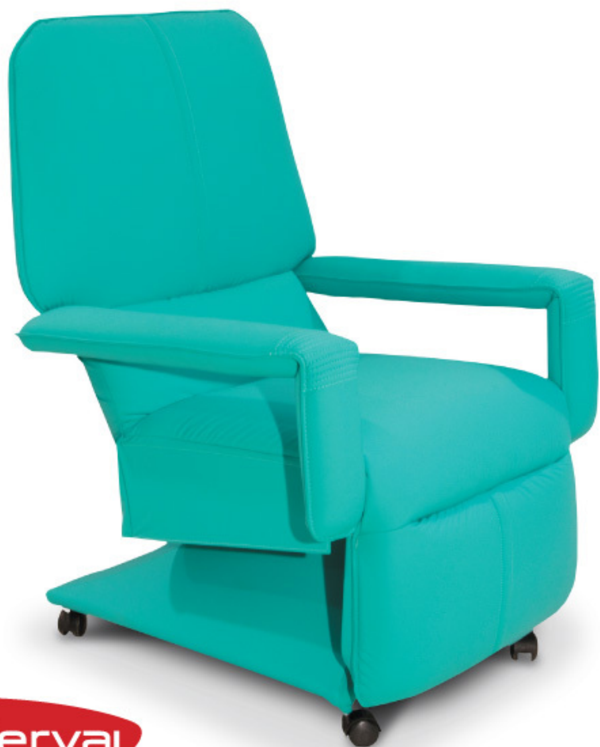
MH 3705 Poltrona Reclinável/Cadeira de hemodiálise/Cadeira acompanhante. Assento e encosto fixos, com molas de aço Nosag, espuma de alta densidade.