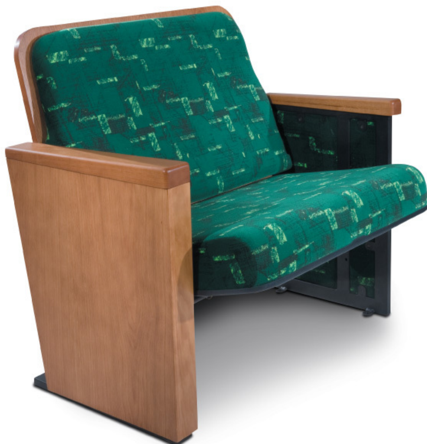
HT 1167 Poltrona para obeso

Fechada L 56 | P 47 | A 83 Aberta L 56 | P 70 | A 83