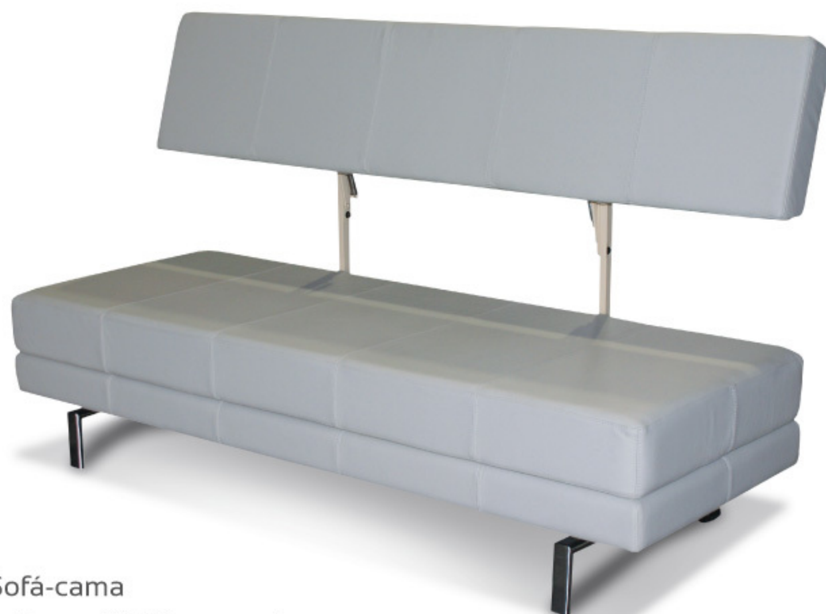
MH 1497 Sofá-cama Assento fixo de chapas MDF e encosto de chapa multilaminada 18mm. Almofada encosto fixa de espuma D33 e assento fixo com espuma D26.