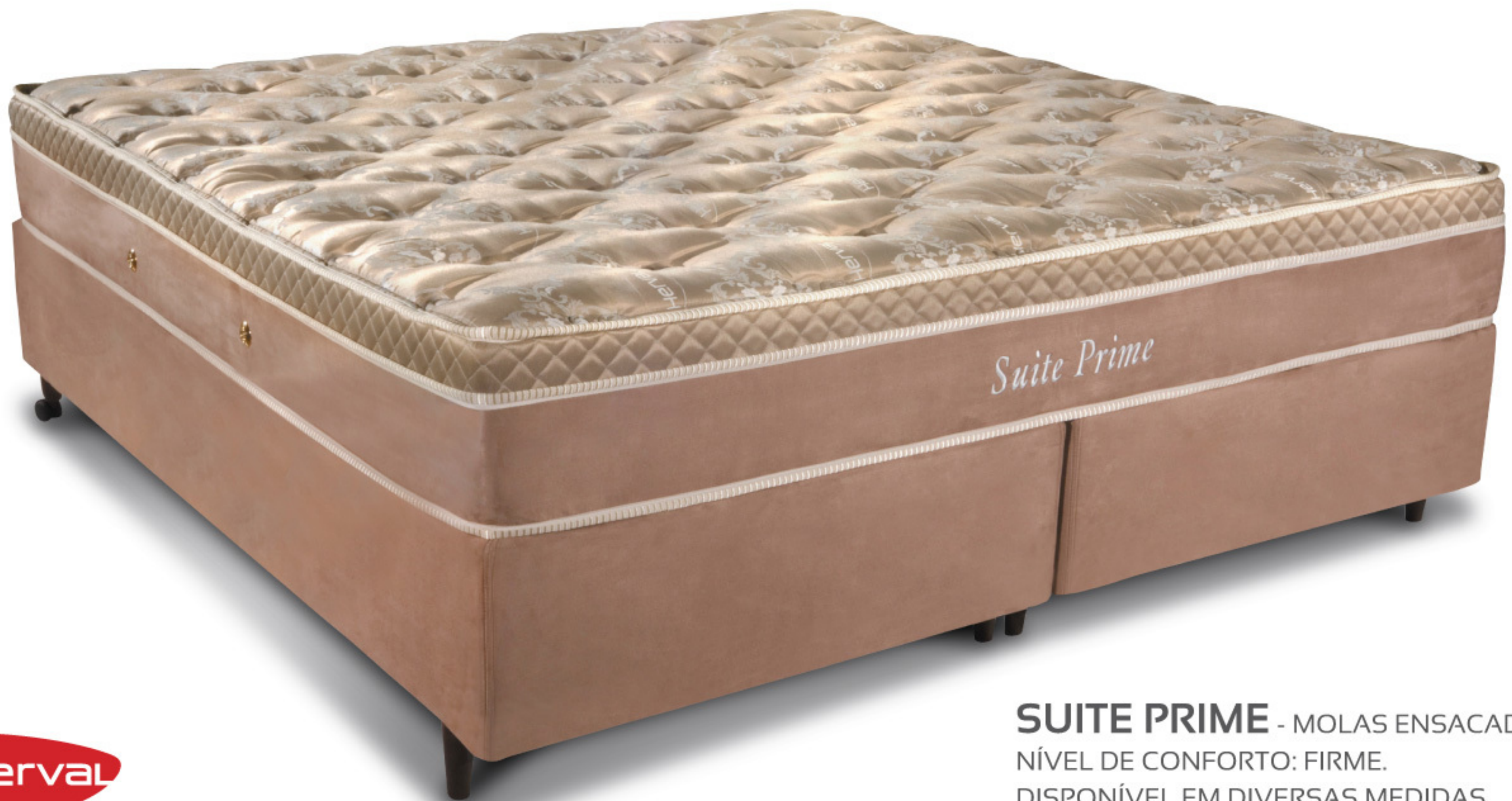
SUITE PRIME - MOLAS ENSACADAS. NÍVEL DE CONFORTO: FIRME. DISPONÍVEL EM DIVERSAS MEDIDAS.