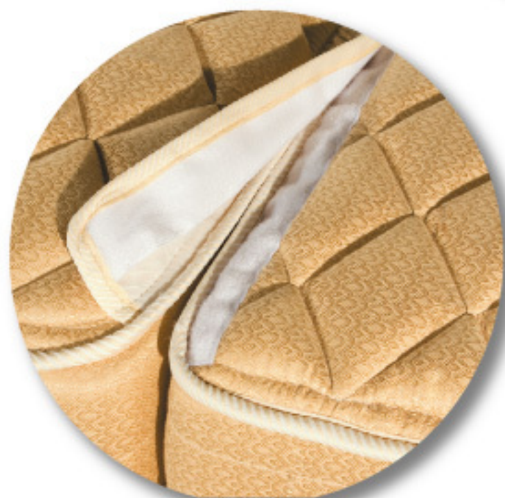
VELCRO PARA UNIÃO DE DOIS COLCHÕES SOLTEIRO