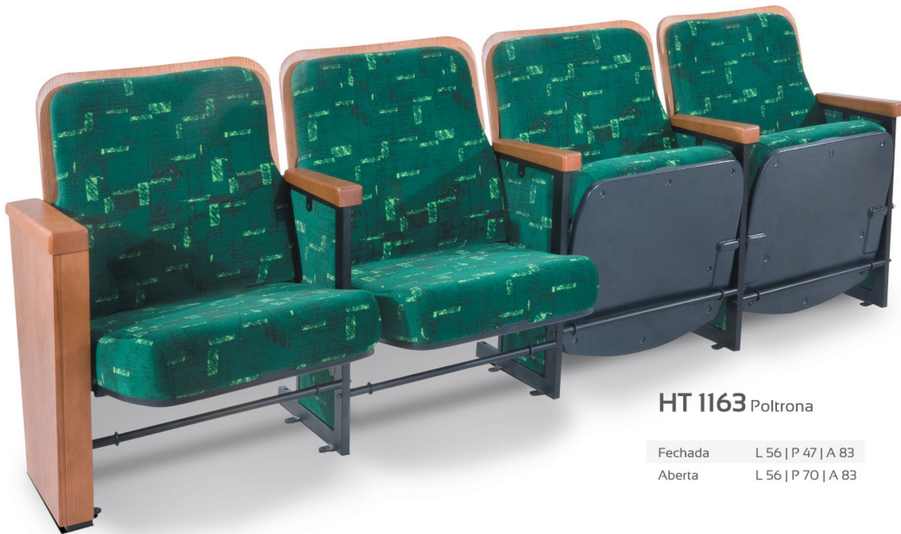
HT 1163 Poltrona

Fechada L 56 | P 47 | A 83 Aberta L 56 | P 70 | A 83