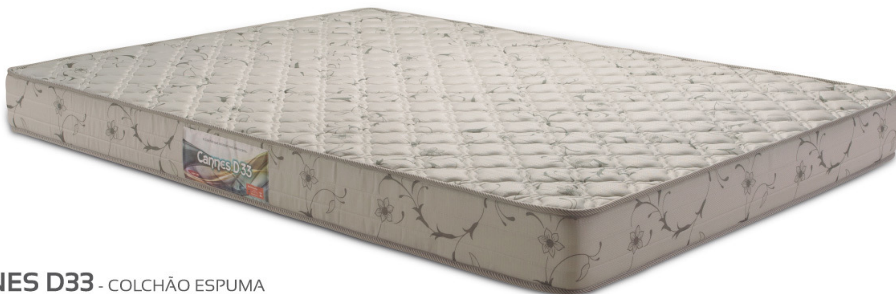
CANNES D33 - COLCHÃO ESPUMA NÍVEL DE CONFORTO: FIRME. DISPONÍVEL EM DIVERSAS MEDIDAS.