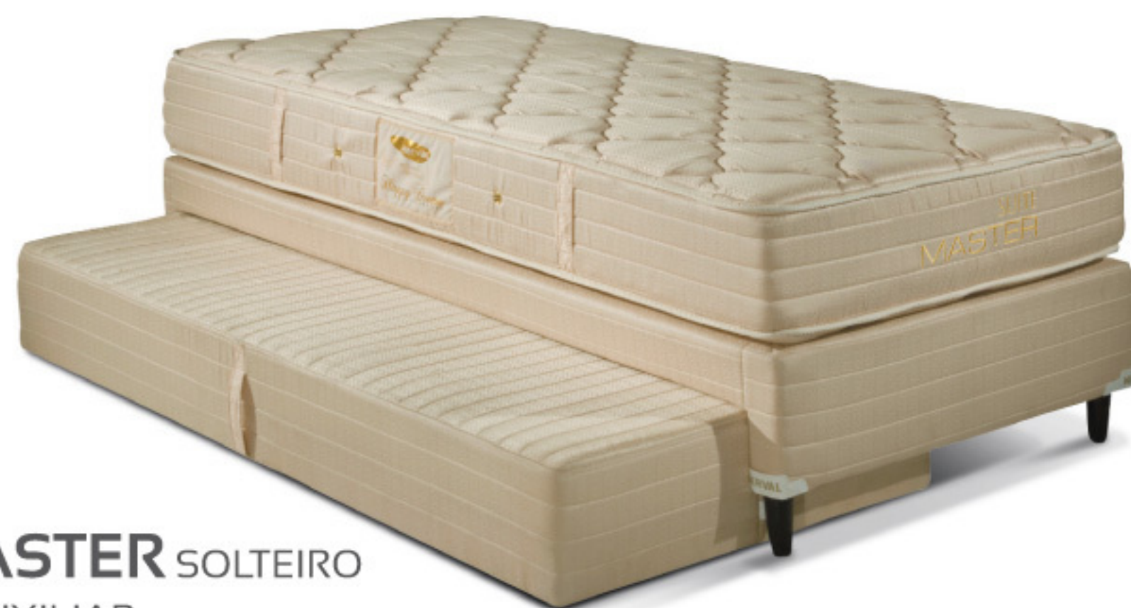
SUÍTE MASTER SOLTEIRO COM CAMA AUXILIAR MOLAS BONNEL NÍVEL DE CONFORTO: FIRME.