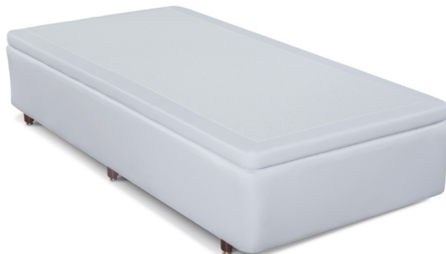
SUITE LUXOR - BOX BAÚ EM KORINO DISPONÍVEL EM DIVERSAS MEDIDAS.