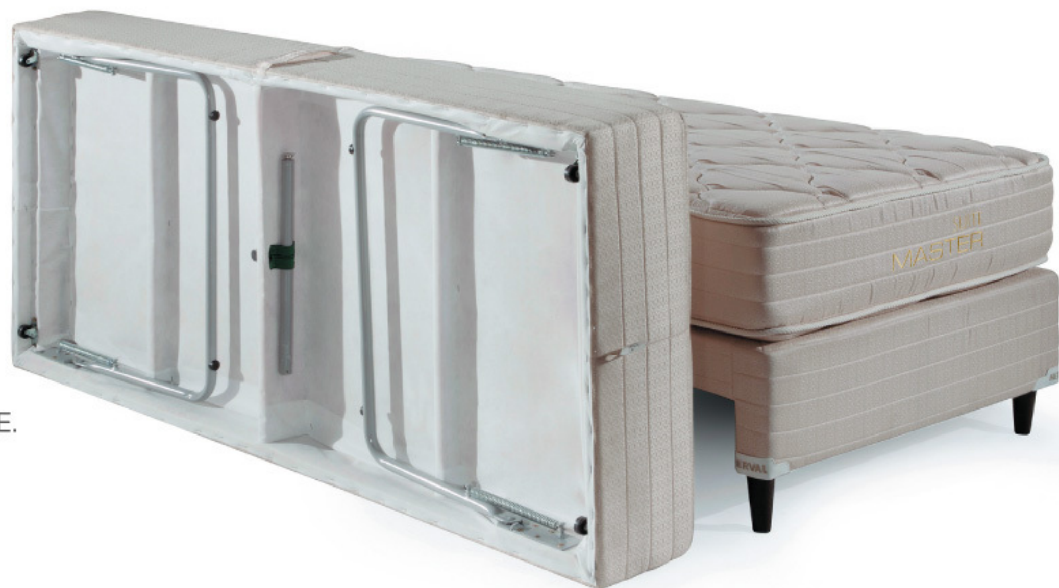
CAMA AUXILIAR PÉS ARTICULÁVEIS MOLAS BONNEL NÍVEL DE CONFORTO: FIRME.