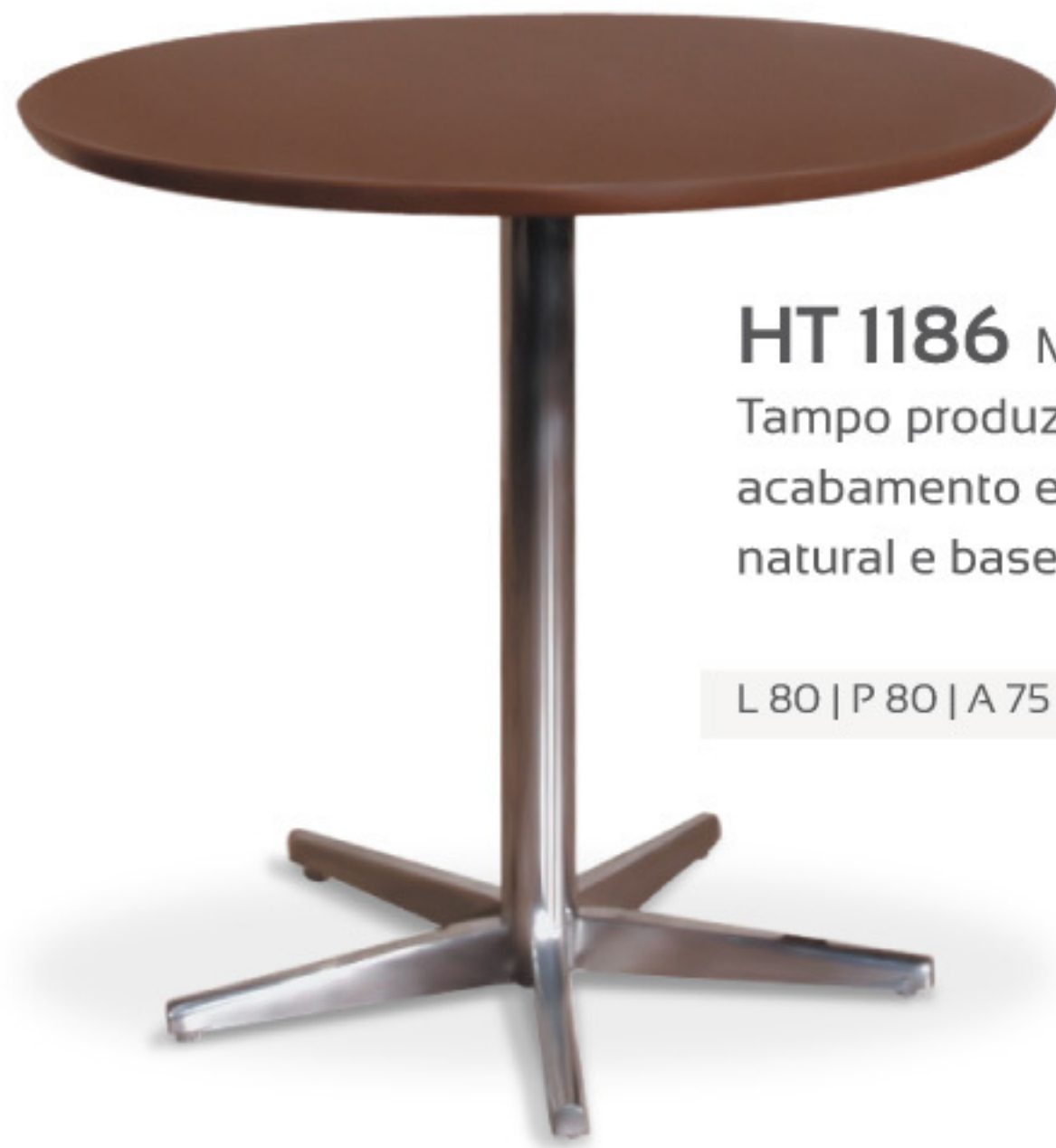
HT 1186 Mesa bar Tampo produzido em chapa de MDF com acabamento em lâminas de madeira natural e base de alumínio polido.