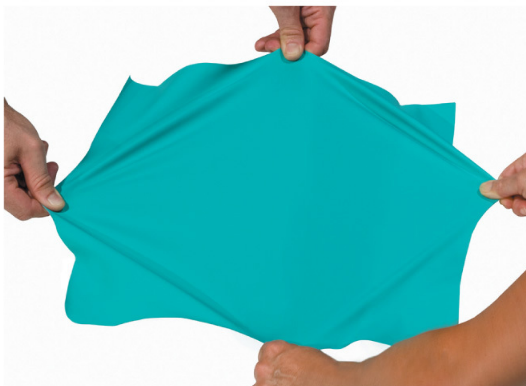
DETALHE ELASTICIDADE BIDIRECIONAL DO REVESTIMENTO.