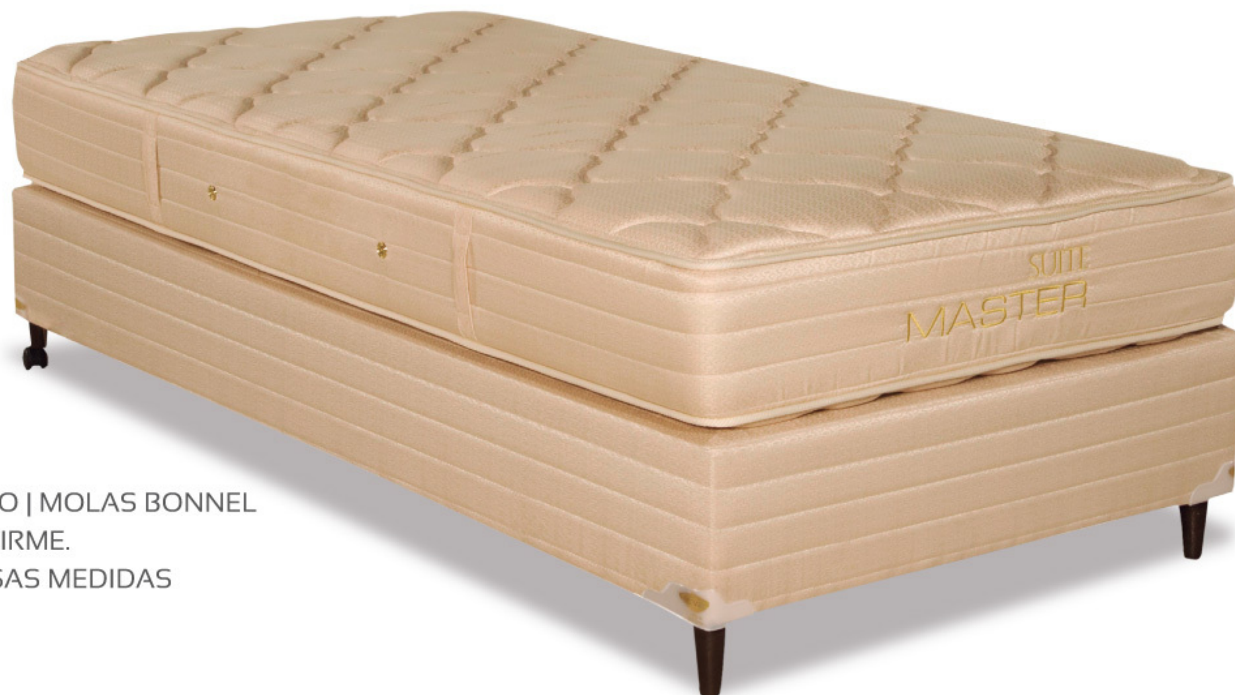
SUÍTE MASTER SOLTEIRO | MOLAS BONNEL NÍVEL DE CONFORTO: FIRME. DISPONÍVEL EM DIVERSAS MEDIDAS