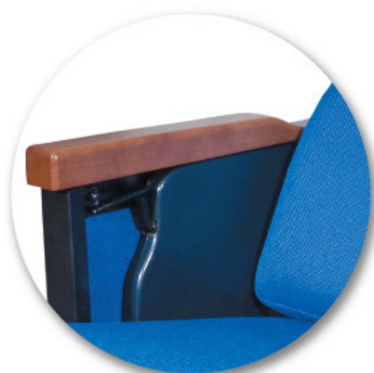
Detalhe da prancheta fechada