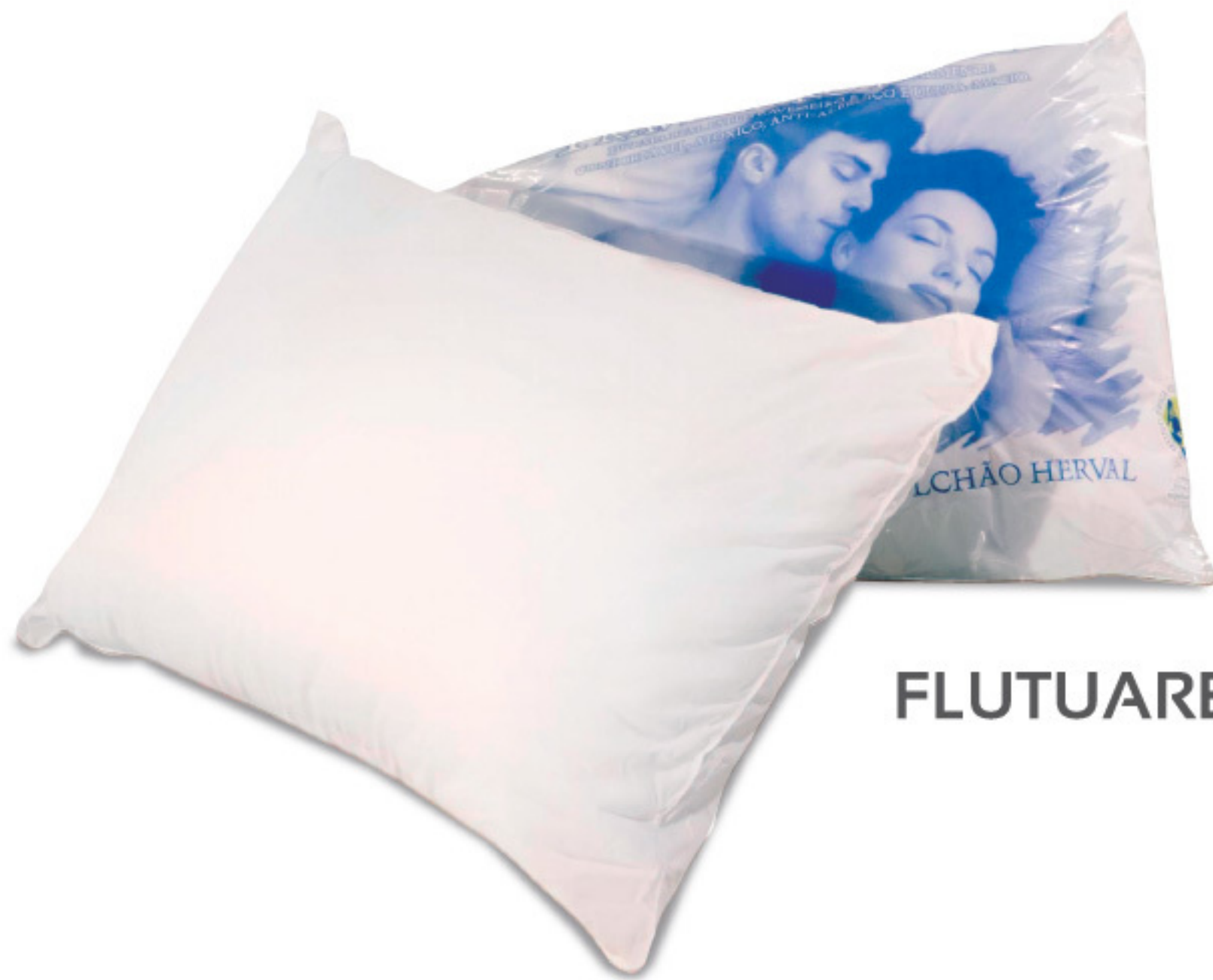
FLUTUARE LIGHT - TRAVESSEIRO DE FIBRA