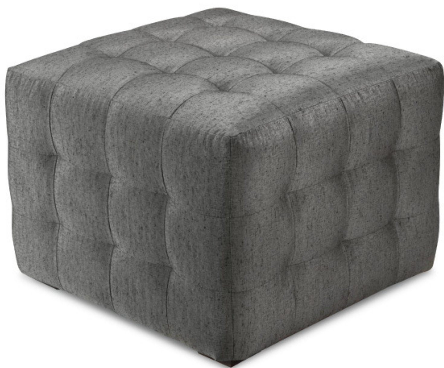
MH 3641 Banqueta Assento fixo, com percintas elásticas.