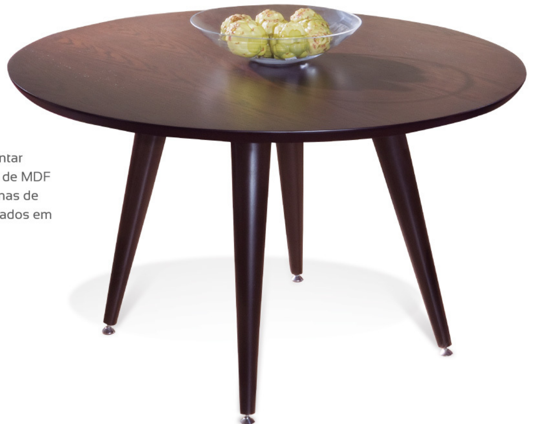
MH 2810 Mesa de Jantar Tampo redondo em chapa de MDF com acabamento em lâminas de madeira natural. Pés torneados em madeira maciça.