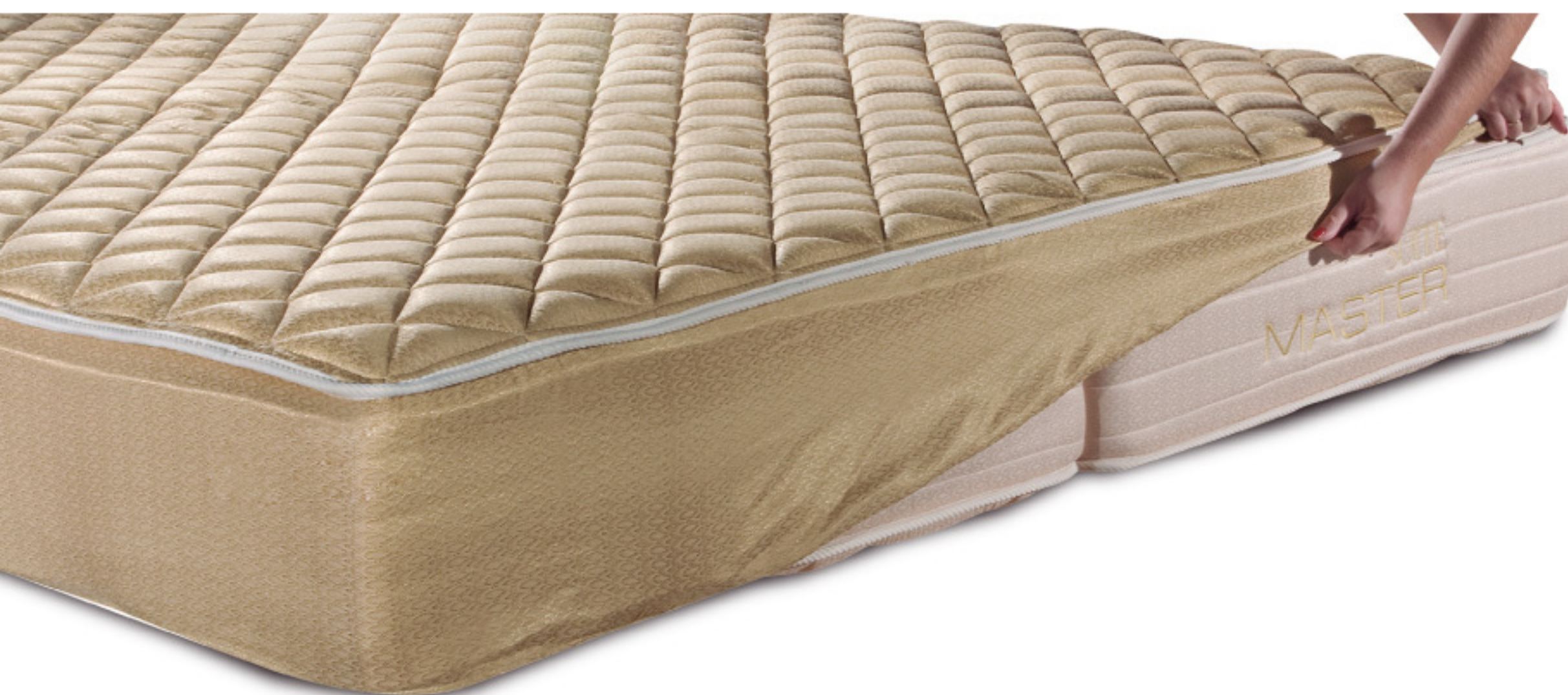
DETALHE CAPA PILLOW DE COLCHÃO